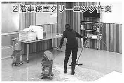
2階事務室クリーニング作業

2カ月間という長い施工期間でしたが、この間に出来館された組合員のみならずにはご不便とご迷惑をおかけしました。工事へのご