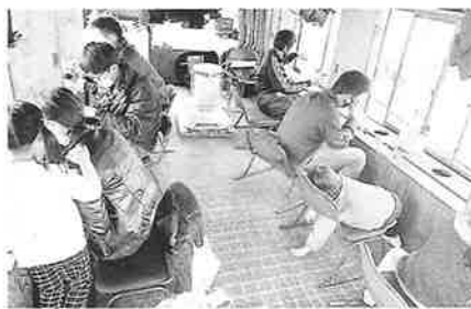
みんな真剣に釣ってます