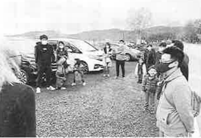
朝の打ち合わせ (部長あいさつ)