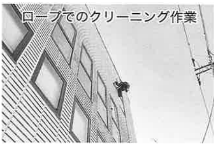
ロープでのクリーニング作業

是非、外観、内観がピカピカに生まれ変わった支部会館へお越しください。皆さまをお待ちしています。