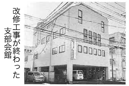
改修工事が終わった支部会館