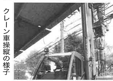
クレーン車操縦の様子

新しい室外機を荷揚げする前に、空調設備の職人さんと綿密な打ち合わせを行い、十分に空気を付けながらクレーンで室外機を持