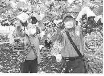
このぶどうがうまそう!!