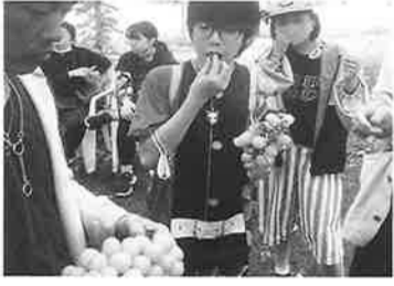
おれのマスクでかいな