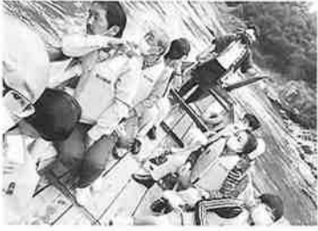
ライン下りはスリル満点