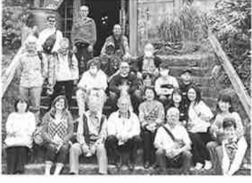
これから常陸牛食べるぞー