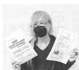
青年部・秋元部長

は、引き続き回収運動に取り組んでいきます。これからもご協力よろしくお願ひします！