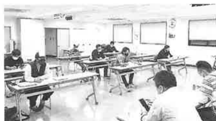
施工業者打ち合わせ会