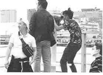
クルージングは気持ち良い