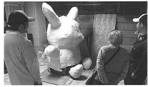
部会前に制作を見学

き、同じ時間を過ごした方 に「一緒に頑張ろうよ」と 組合加入を勧める姿、私は 同じだと思えます。メー デーは労働者の祭典で、自 分たちの要求を掲げる日。 青年部では「建設職人の地 位向上」を掲げ、それを達 成するためには、まず団結 が必要だと考え、関連のあ るポケモンを制作しました。 デコ制作では、青年部を 中心に様々な方にお手伝い が参加されました。その 後、我々が目指しているこ とや主張をシニアレコー ルに乗せ、防災有明公園か ら豊洲まで堂々とデモ行進 を行いました。